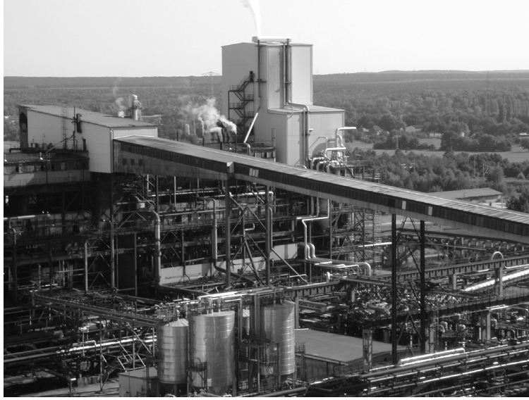
Şekil-2 : BGL Gazlaştırıcısı Almanya Schwarzepumpe Tesisleri Görünümü